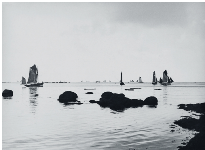
Bord de mer, s.l., Alfred Latour s.d.