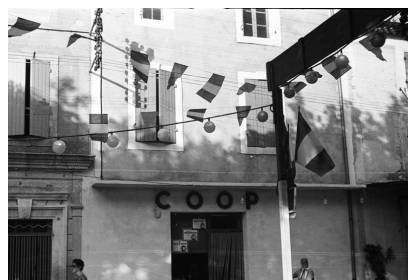
Eygalières, Alfred Latour s.d.