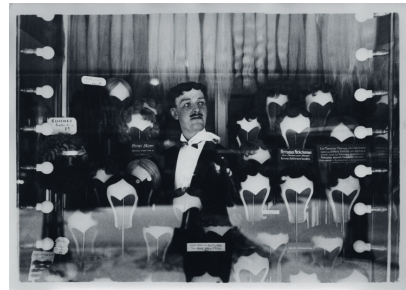
Les Vitrites, Paris, Alfred Latour ca 1936