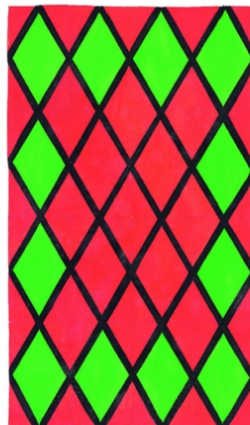
Toiles de Fontenay, Alfred Latour 1948 © Fondation Alfred Latour, tous droits réservés