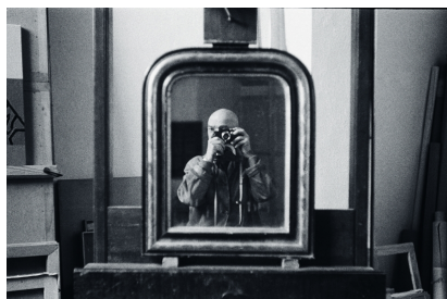
Autoportrait, Alfred Latour Atelier de l'artiste, Eygalières ca 1950 Photographie © Fondation Alfred Latour, tous droits réservés

En photographe amoureux de l'enveloppe des choses, Alfred Latour s'est imposé dans les années 1930-50. Entre bords de Seine et bords de mer, une exposition donne à voir son oeuvre au musée Réattu d'Arles.