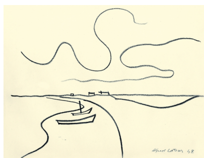
Camargue, Alfred Latour 1948 © Fondation Alfred Latour, tous droits réservés