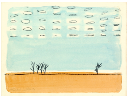
Paysage, petits nuages, Alfred Latour 1961