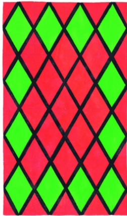
Toiles de Fontenay, Alfred Latour 1948 © Fondation Alfred Latour, tous droits réservés