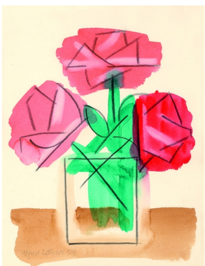
Trois roses, Alfred Latour 1959 © Fondation Alfred Latour, tous droits réservés