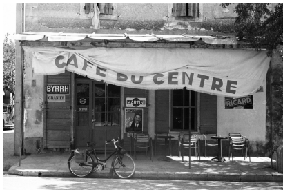
Eygalières, Alfred Latour s.d.