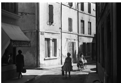
Arles, Alfred Latour s.d.