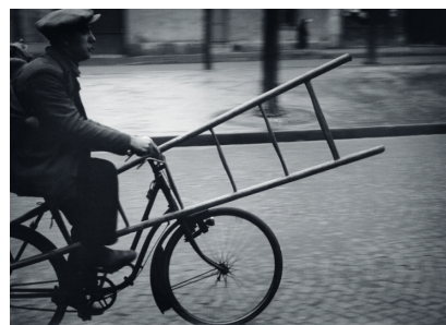
Le Vélo, Paris, Alfred Latour s.d.