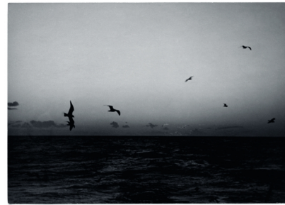
Bord de mer, s.l., Alfred Latour s.d.