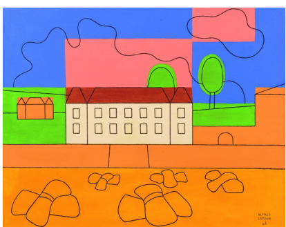
Le Château blanc, Alfred Latour 1948 © Fondation Alfred Latour, tous droits réservés