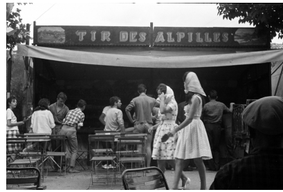
Eygalières, Alfred Latour s.d.