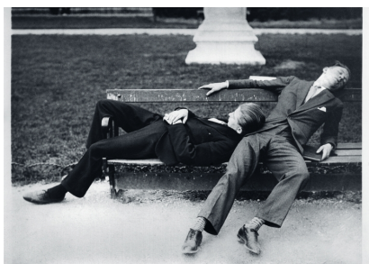
Le Banc, Paris, Alfred Latour s.d.